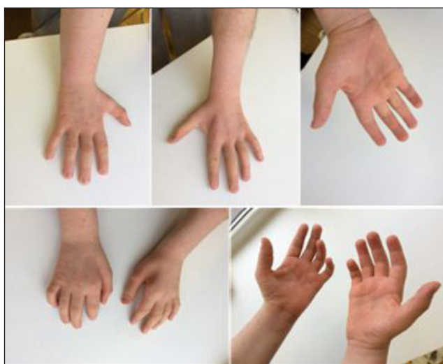
Рис. 1. Атрофические изменения кистей рук Fig. 1. Wasting of small muscles of both hands

Объективно на момент госпитализации: сознание ясное. Психотические, эмоциональные и интеллектуально-мнестические нарушения не выявлены. Черепные нервы: гемианопсии нет. Зрачки правильной формы, среднего диаметра, D=S . Реакция зрачков на свет (прямая и содружественная) живая, симметричная. Движения глазных яблок в полном объеме. Диплопии нет. Нарушений чувствительности на лице не выявлено. Лицо симметрично. Речь не нарушена. Дисфагии, дисфонии нет. Язык по средней линии. Uvula по средней линии. Мягкое небо подвижно, глоточные рефлексы живые. Симптомы орального автоматизма отрицательные. Двигательная система: сила мышц дистальных отделов верхних конечностей слева до 3 баллов, справа — до 3,5 балла. Сила остальных мышц — 5 баллов. Сухожильные рефлексы: с верхних конечностей: карпо-радиальные, бицепс- и трицепс-рефлексы S=D , снижены; с нижних конечностей — S=D , коленные снижены, ахилловы снижены. Патологических кистевых знаков не выявлено. Патологических стопных знаков не выявлено. Тонус мышц снижен