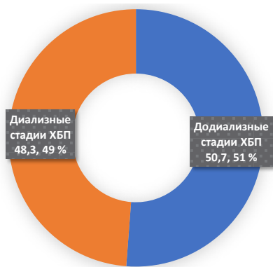
Рис. 1 Распределение пациентов с ХБП, состоявших в реестре до 2019 г.